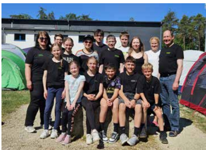
Die Schützen und Betreuer vom Schützenverein Schuttertaler Heide Egweil beim 3-tägigen Zeltlager mit Gaujugendturnier bei strahlendem Sonnenschein.

Am 05.07.2026 findet das diesjährige Willibaldsfest mit einer hl. Messe in Attenfeld bei der Willibaldskapelle statt. Die Messe beginnt um 10.00 Uhr und wird von den Schuttertaler Musikanten musikalisch umrahmt. Wer will, kann auch gerne die Prozession von der Attenfelder Kirche zur Kapelle begleiten. Treffpunkt ist hier um 9:30 Uhr bei der Kirche. Nach der hl. Messe findet traditionell am Feuerwehrhaus in Attenfeld wieder eine Bewirtung statt.