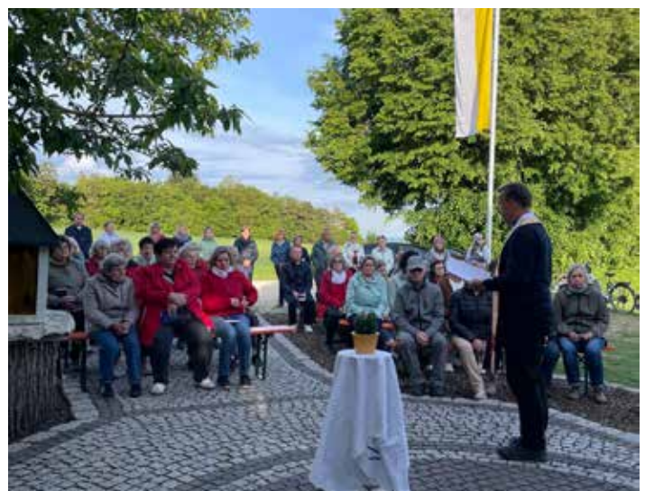
Der Frauen- und Mädchenverein gestaltete eine Maiandacht zum Thema „Kaktus“. Mit besinnlichen Texten, Gebeten und Liedern wurde der Marienmonat Mai in gemeinsamer Feier würdig begangen.