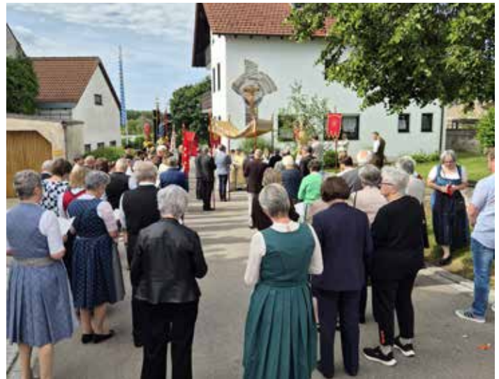
Zum Fronleichnamsfest kamen in Wolkertshofen die Gläubigen zusammen.