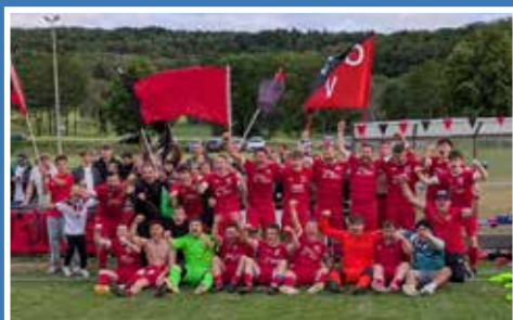
Aufstieg DJK Pietenfeld-Adelschlag