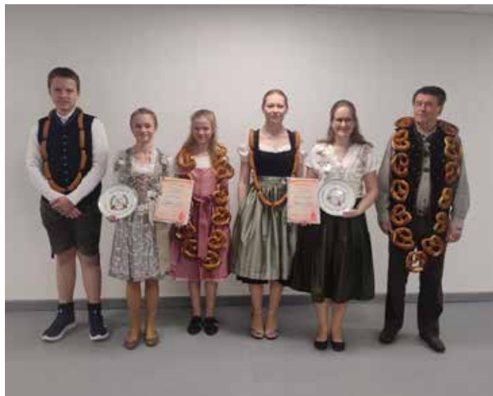
Die neuen Könige im Sportjahr 2025/26.