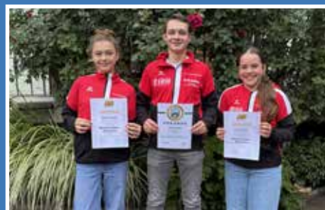
Aufstiegsfeier Schützen Tilly Wolkertshofen