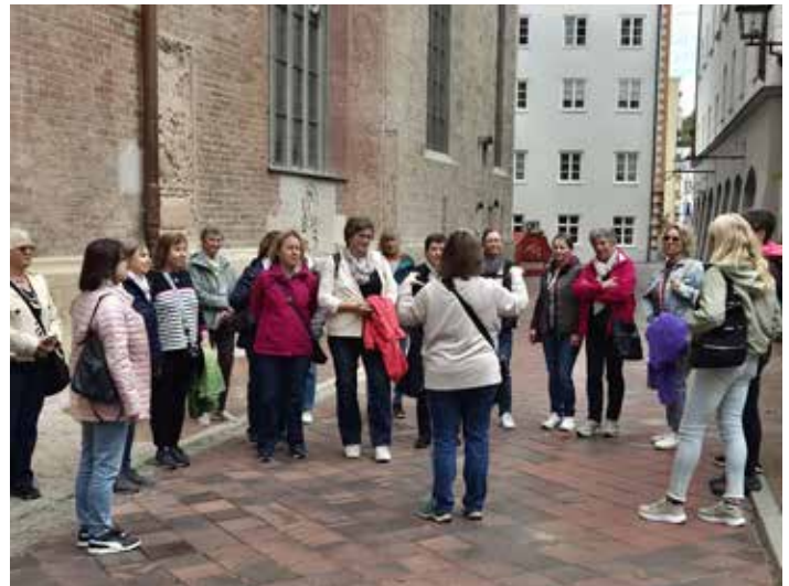
Auch 2026 waren die Wolkertshofer Landfrauen, zusammen mit dem Bauernverband, auf Bildungsreise unterwegs. Dieses Jahr ging es nach Wasserburg am Inn, einer Nudelmanufaktur und zu einer Ölmühle. Es war wie immer ein sehr gelungener Ausflug.