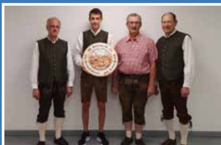
Jahreshauptversammlung Schützen Egweil